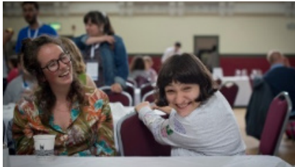
El Arca somos nosotros juntos