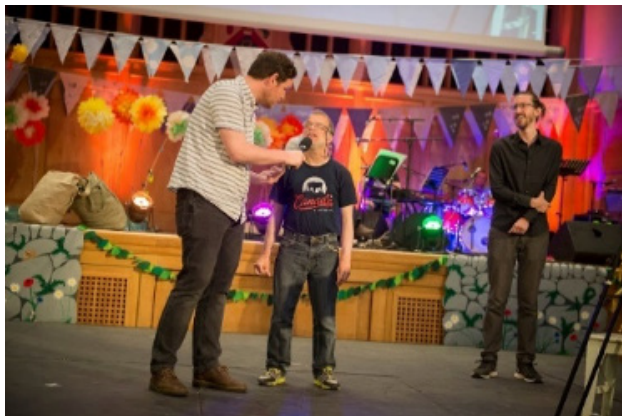
Tenemos una misión común