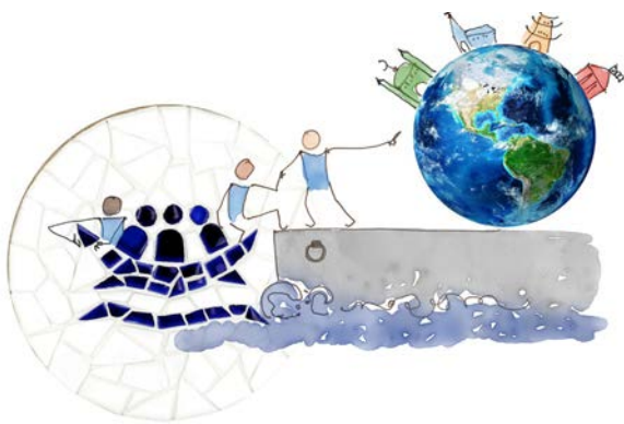
Tenemos una misión común