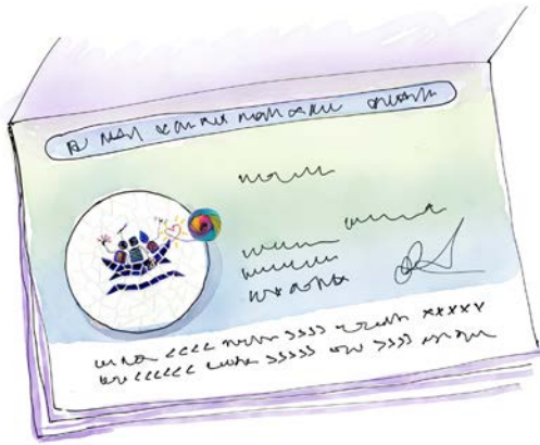
El Arca somos nosotros juntos