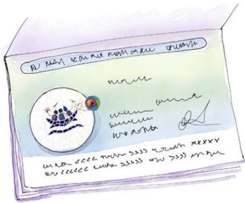
L'Arche to my razem