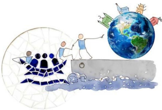
Mamy wspólną Misję